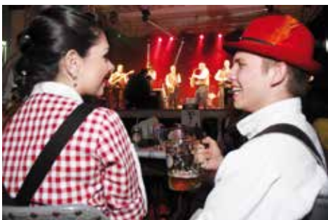
Teve muito Chopp e música alemã no Festival