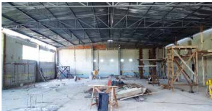
Pavimento Superior em janeiro de 2016