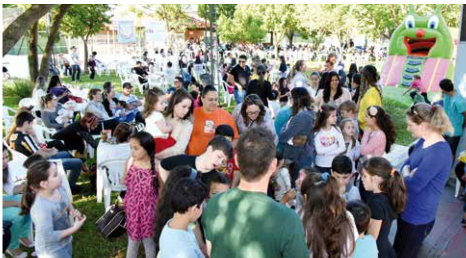
Cerca de 500 pessoas estiveram presentes

Em outubro, mês das crianças, os pequeninos tiveram um dia de programações especiais dedicadas somente a eles. A tarde muito animada e descontraída iniciou com o desfile de modas da loja Cia da Criança, no qual a galerinha brilhou na passarela. Além do desfile, piscinas, brinquedos infláveis, cama elástica, pracinha, escolinha de tênis, vôlei, pintura artística, música e a comida que a criançada gosta fizeram parte da programação que divertiu as crianças e toda a família.