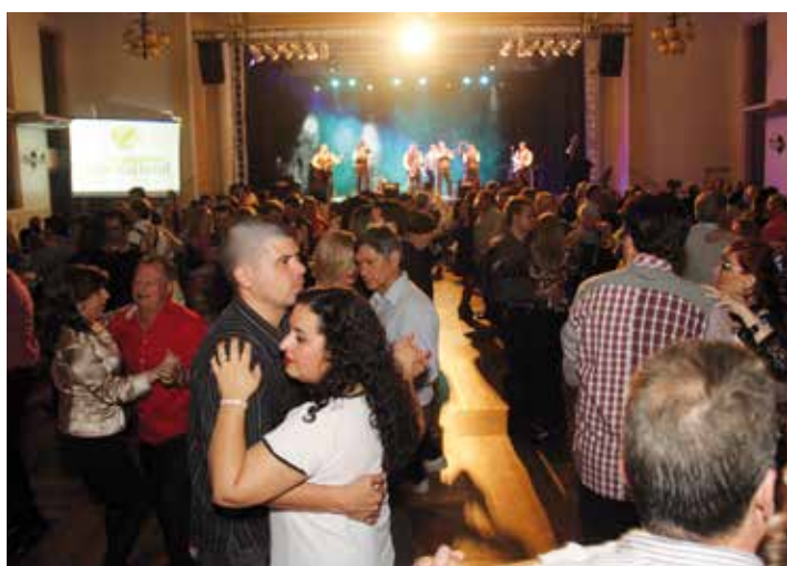
Mais de 500 pessoas prestigiaram o evento no Salão Nobre da Sogi