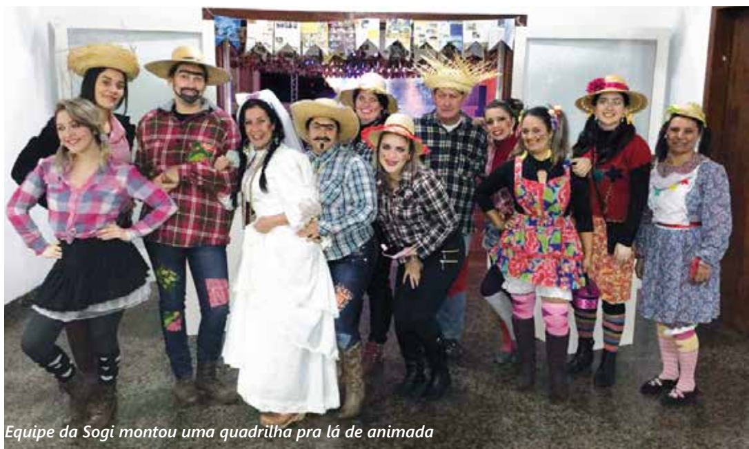
Equipe da Sogi montou uma quadrilha pra lá de animada

O evento denominado Festa Julina reuniu associados e toda a comunidade de Ijuí e região, ao quais puderam participar de uma festa típica caipira no mês de julho. Teve muito quentão, pé-de-moleque, bolo, pinhão, apresentações artísticas e demais brincadeiras típicas de São João. Além da decoração temática, as pessoas foram caracterizadas e entraram no ritmo da festa.