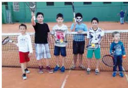
Recreação de Tênis