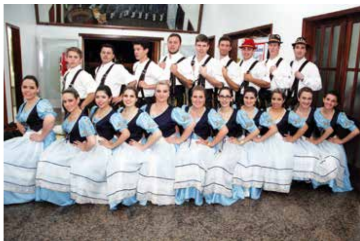
Apresentação do Grupo de danças Fröhe Jugend

A 4ª edição do Festival do Chopp da Sogi foi sucesso absoluto, no qual muita gente bonita e animada aproveitou um bom chopp gelado ao som da banda Os Futuristas. O evento também teve apresentações de danças do Grupo alemão Fröhe Jugend, que interagiu com os convidados na pista de dança. Nesta edição, na entrada do evento, foram distribuídos copos de vidro personalizados com a marca do Festival. Confira as fotos!