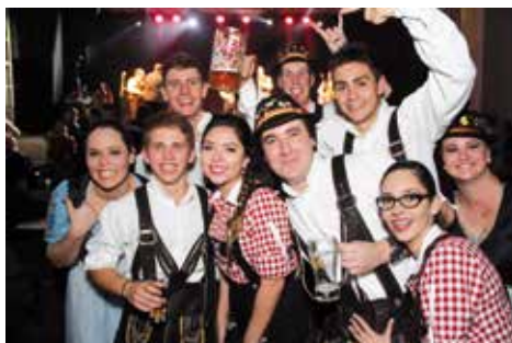
Grupo Fröhe Jugend curtindo o festival