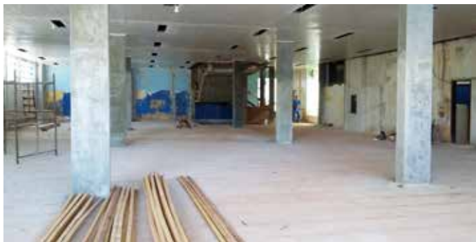
Pavimento térreo em janeiro de 2016