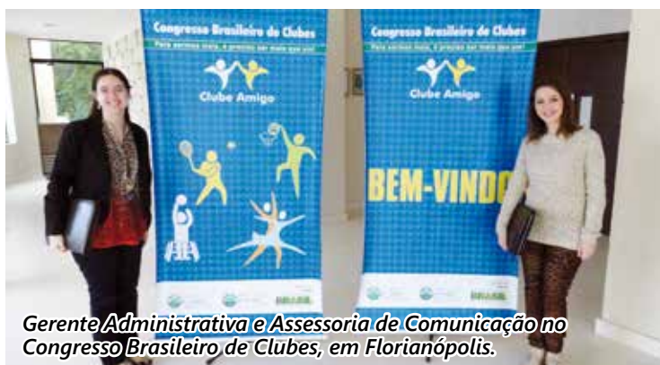
Gerente Administrativa e Assessoria de Comunicação no Congresso Brasileiro de Clubes, em Florianópolis.