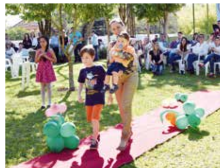
Desfile de Modas