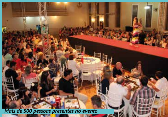
Mais de 500 pessoas presentes no evento

A festa teve momentos especiais, com música agradável, desfile de modas produzido por Luiz Carlos Leindecker, que trouxe as últimas tendências da coleção primavera/verão das lojas Cia. da Criança, Kika Moda Íntima, Maria Canela Calçados, Mulher Bonita e Óptica Wolf. O cardápio foi um excelente coquetel campeiro preparado pela equipe da Sogi. O momento especial da noite foi a apresentação das Sobe-ranas 2016 do Clube.