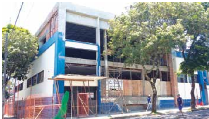
Fachada será toda revestida de vidros

"É um passo inovador que a Sogi está dando com esse empreendimento, pensando em melhorar os ambientes para atividades físicas que possibilitam a seus associados melhor comodidade para se ter maior qualidade de vida", conclui o vice patrimonial. A inauguração da nova academia ainda não tem data definida.