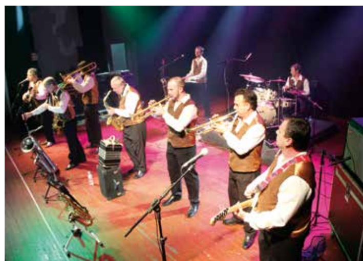
Banda Os Futuristas aproveitou o momento para gravar seu primeiro dvd